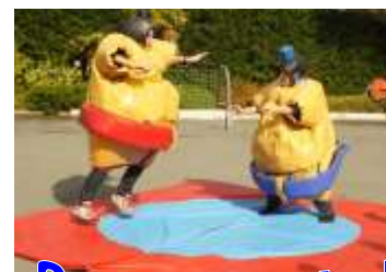
Sumo Partie !